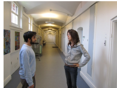
Imam og præst fra IKS i Vestre Fængsels sygeafdeling

I mange år var der brug for undervisning, oplysning, rådgivning og debatter om islam og forholdet mellem islam og kristendom. I dag foregår disse aktiviteter mange andre steder, og centret arbejder nu mest med sociale og diakonale fælles projekter, praksisorienterede studiegrupper, studierejser samt udgivelse af tidsskrift.